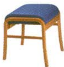
Pouf N° 2641 Dès Fr. 198.-