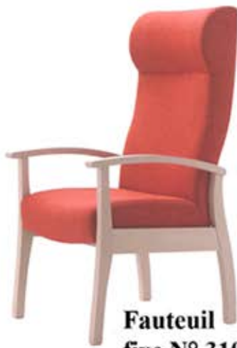
Fauteuil Relax fixe N° 310-F Dès Fr. 565.-