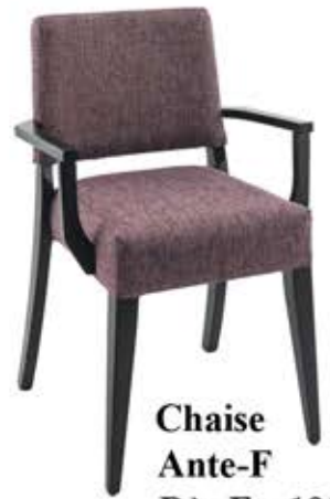
Chaise Ante-F Dès Fr. 195.-