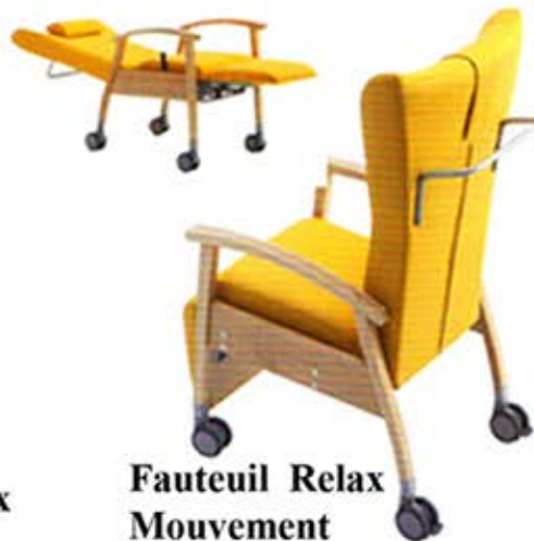
Fauteuil Relax Mouvement à gaz - N° Xpert Dès Fr. 1195.-