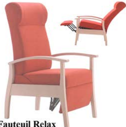
Fauteuil Relax Mouvement manuel N° 310-R Dès Fr. 675.-