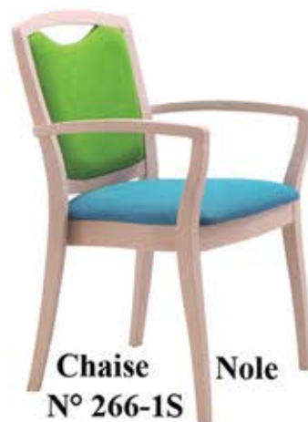
Chaise Nole N° 266-1S Dès Fr. 238.-