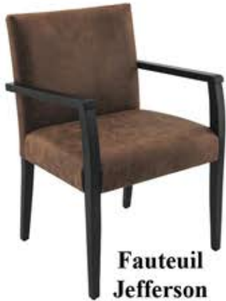
Fauteuil Jefferson Dès Fr. 235.-