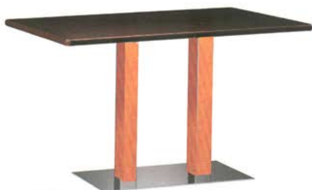
Table de 120 x 80 cm à 2 colonnes en acier recouvertes de bois Plateau stratifié avec bords ABS Dès Fr. 530.-