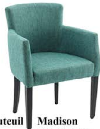
Fauteuil Madison Dès Fr. 248.-