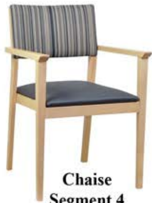
Chaise Segment 4 Dès Fr. 225.-