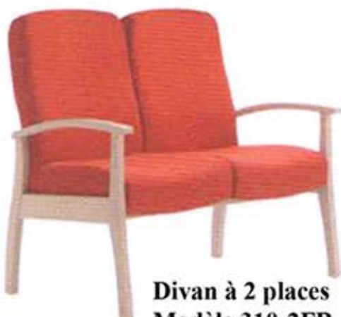
Divan à 2 places Modèle 310-2FB Dès Fr. 895.-