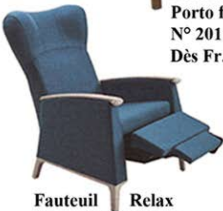
Fauteuil Relax Mamy 57-63 / 2RP Mouvement manuel Dès Fr. 1580.-