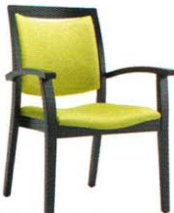
Chaise Fandango N° 33-13/1 Dès Fr. 298.-