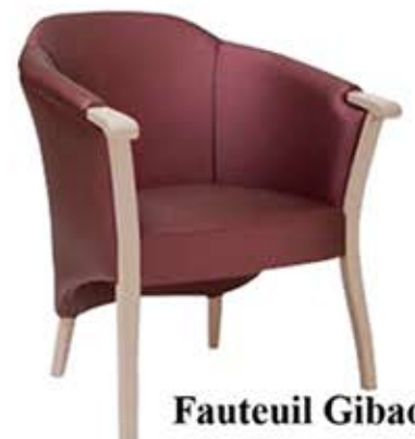
Fauteuil Gibao Dès Fr. 945.-