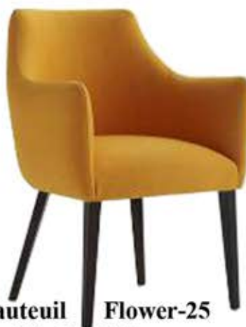
Fauteuil Flower-25 Dès Fr. 385.-