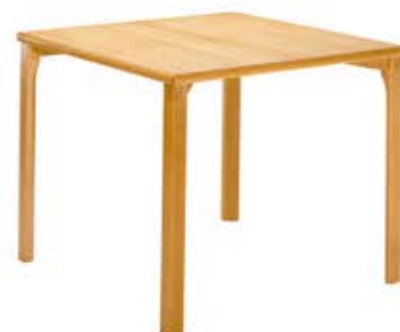
Table de 80 x 80 cm Plateau stratifié / bords ABS 4 pieds bois Dès Fr. 348.-

Les articles illustrés sur ce dépliant ne représentent qu'un aperçu de notre assortiment Vous pouvez aussi visualiser d'autres modèles sur www.cfi-mobilier.ch