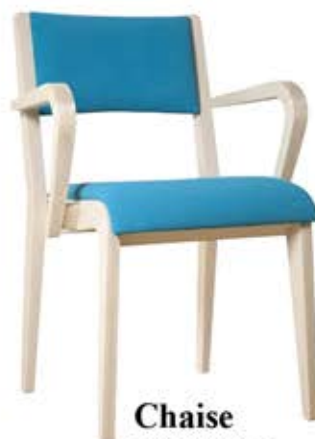
Chaise Oli 259-1 Dès Fr. 248.-