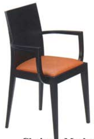
Chaise Masha Dès Fr. 185.-