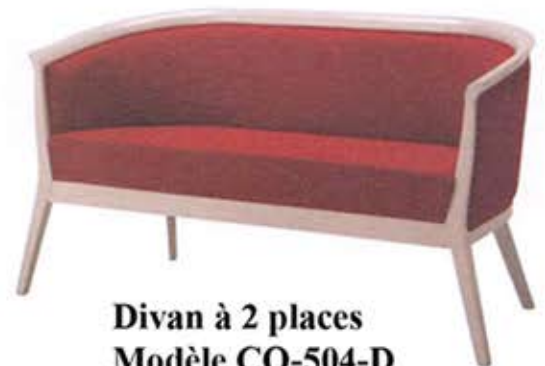
Divan à 2 places Modèle CO-504-D Dès Fr. 895.-