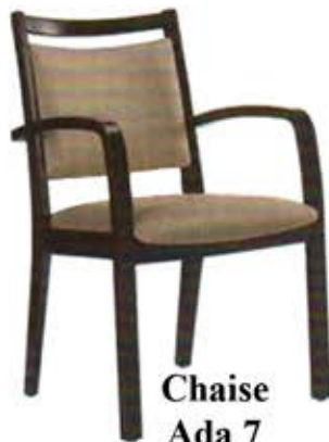
Chaise Ada 7 Dès Fr. 215.-