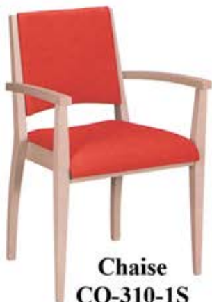
Chaise CO-310-1S Dès Fr. 188.-