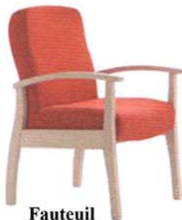
Fauteuil 310-FB Dès Fr. 435.-