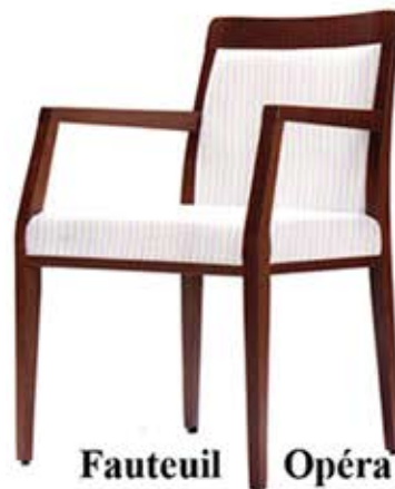
Fauteuil Opéra Dès Fr. 268.-