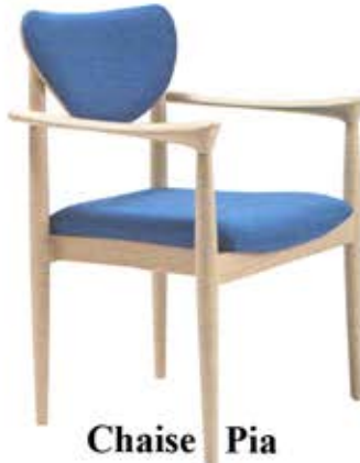
Chaise Pia N° 48-13/2 Fr. 285.-