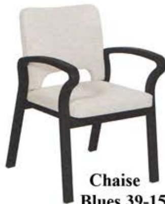
Chaise Blues 39-15/1 Dès Fr. 295.-