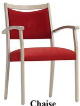
Chaise Wind 5 Dès Fr. 235.-