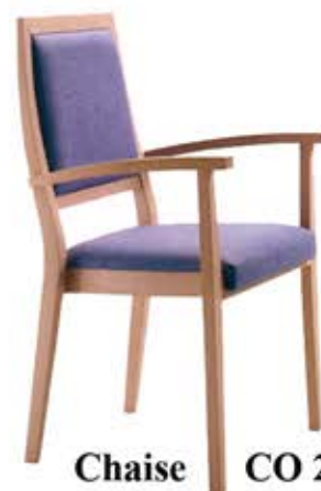
Chaise CO 269-1S Dès Fr. 188.-