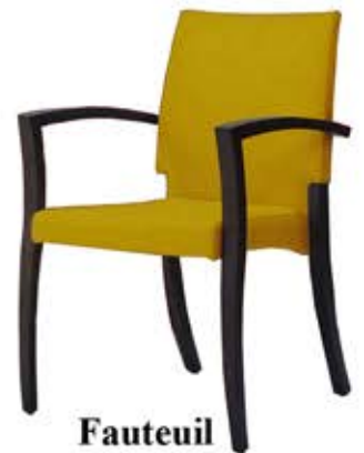
Fauteuil Theorama 44-14/5 Dès Fr. 365.-