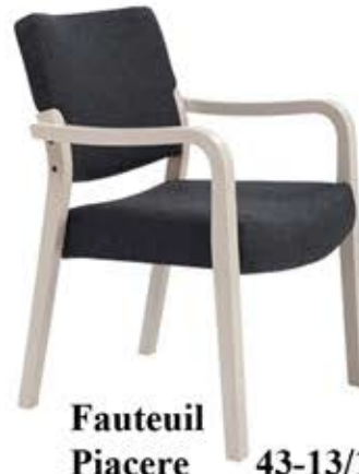
Fauteuil Piacere 43-13/1 Dès Fr. 385.-