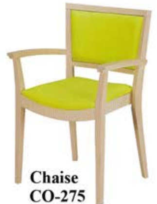
Chaise CO-275 Dès Fr. 198.-