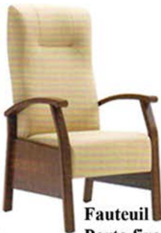
Fauteuil Relax Porto fixe N° 2011-1-30 Dès Fr. 645.-