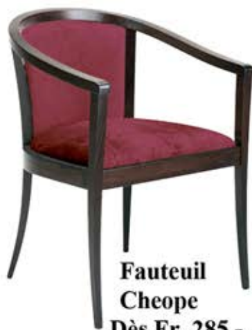
Fauteuil Cheope Dès Fr. 285.-