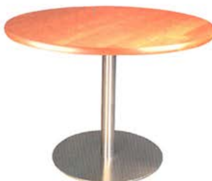
Table ronde de Ø 120 cm Colonne centrale en acier Plateau stratifié / bords ABS Dès Fr. 465.-