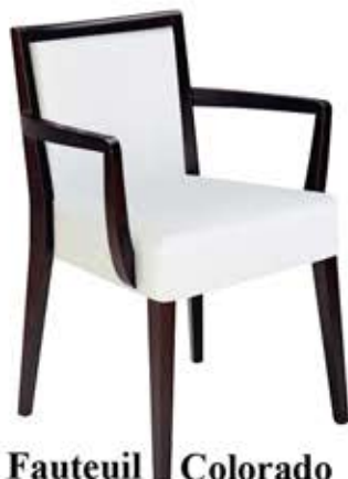
Fauteuil Colorado N° 20-22/2 Dès Fr. 288.-