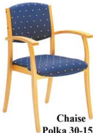
Chaise Polka 30-15/1 Dès Fr. 245.-