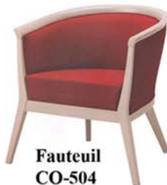
Fauteuil CO-504 Dès Fr. 448.-