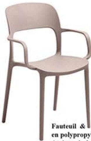
Fauteuil & chaise GS-1069 en polypropylène & fibre de verre 4 teintes à choix Fr. 98.-