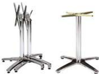
Autres piétements pour tables de terrasse Changement des plateaux sur vos pieds de table