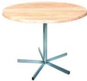
Table ronde de Ø 120 cm Pied central en acier zingué Avec plateau en werzalit Dès Fr. 355.- Avec plateau compact, prix sur demande