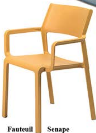
Fauteuil Senape Polypropylène et fibre de verre Dès Fr. 85.-