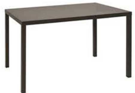
Table rectangulaire de 120 x 80 cm Structure en acier zingué recouvert de polyester Teintes Anthracite ou blanc Dès Fr. 315.-