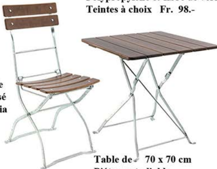
Table de 70 x 70 cm Piétement pliable Fr. 168.-