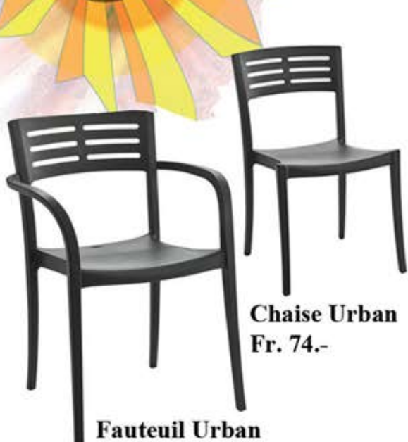
Chaise Urban Fr. 74.-