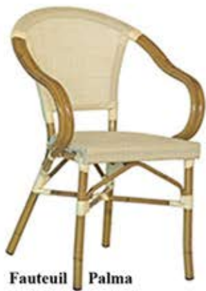
Fauteuil Palma Alu/rotin & toile textylène Fr. 124.-