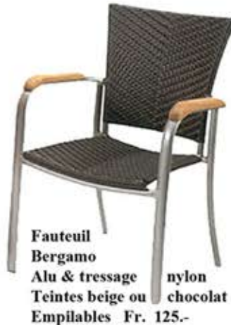
Fauteuil Bergamo Alu & tressage nylon Teintes beige ou chocolat Empilables Fr. 125.-