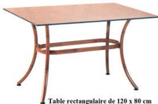
Table rectangulaire de 120 x 80 cm Piétement en aluminium vernie Teintes Anthracite ou Malacca Avec plateau compact Dès Fr. 365.- Avec plateau en Topalit Dès Fr. 315.-