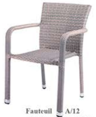
Fauteuil A/12 Alu & tressage nylon empilable Fr. 112.-