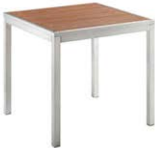
Table carrée de 80 x 80 cm Structure en aluminium Plateau en lattes de nobois Teintes: Gris ou naturel Dès Fr. 445.-