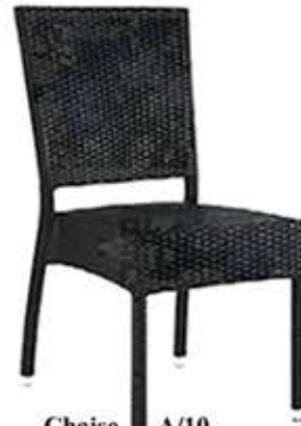
Chaise A/10 empilable Fr. 112.-