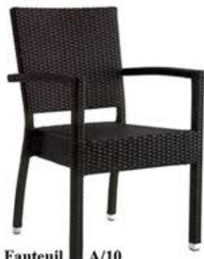
Fauteuil A/10 Alu & tressage nylon empilable Fr. 125.-