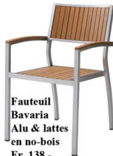
Fauteuil Bavaria Alu & lattes en no-bois Fr. 138.-