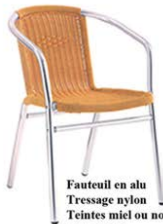
Fauteuil en alu Tressage nylon Teintes miel ou noir Dès Fr. 75.-