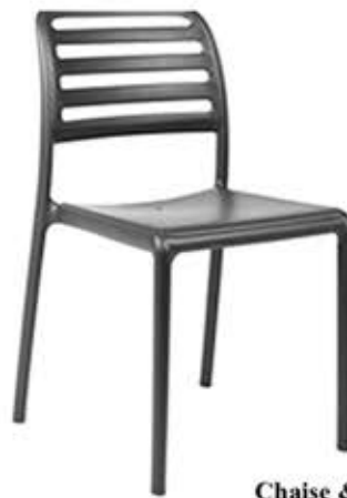
Chaise & fauteuil Costa en polypropylène & fibre de verre 5 teintes à choix Fr. 69.-