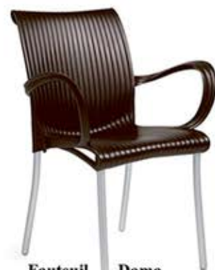
Fauteuil Dama Armature en aluminium Coque en polypropylène et fibre de verre 3 teintes à choix Dès Fr. 79.-