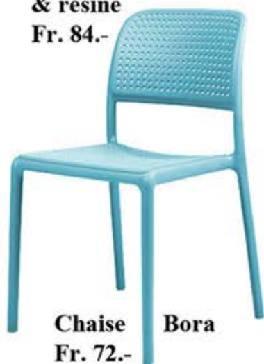
Chaise Bora Fr. 72.-