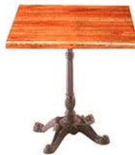
Table carrée de 70 x 70 cm Pied parisien en fonte noire avec vis de nivellement Avec plateau compact Dès Fr. 278.- Avec plateau werzalit Dès Fr. 248.-