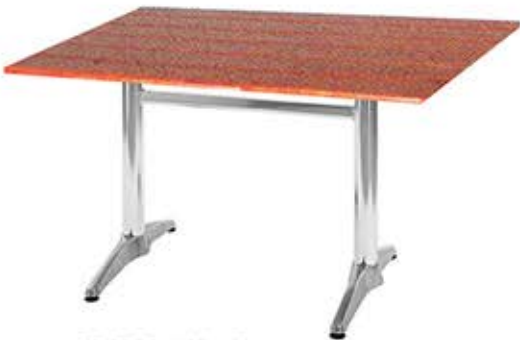
Table de 110 x 70 cm Pied fixe en aluminium Plateau en werzalit Dès Fr. 320.-