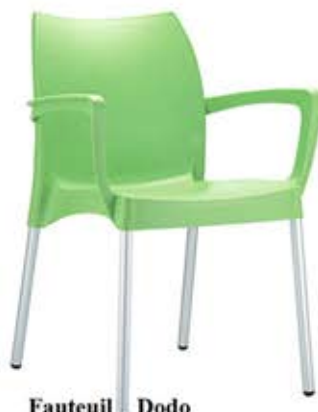
Fauteuil Dodo en polypropylène Pieds alu adonisés Fr. 72.-