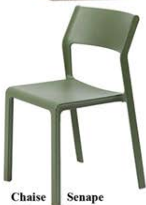
Chaise Senape Polypropylène et fibre de verre Dès Fr. 76.-