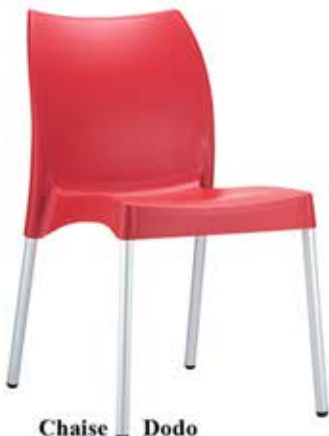
Chaise Dodo en polypropylène Pieds alu adonisés Fr. 65.-