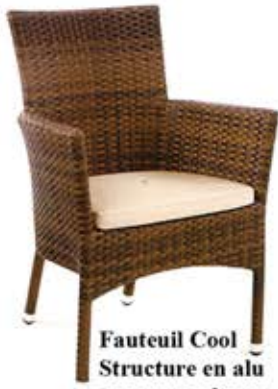
Fauteuil Cool Structure en alu tressage nylon avec coussin 3 Teintes à choix Fr. 135.-