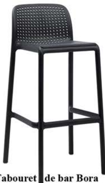
Tabouret de bar Bora Polypropylène & fibre de verre Teintes à choix Fr. 98.-