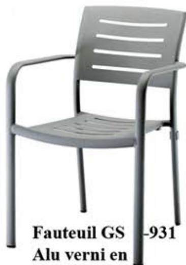
Fauteuil GS -931 Alu verni en argent ou blanc Fr. 88.-