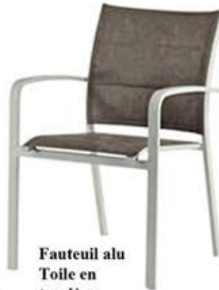
Fauteuil alu Toile en textylène Empilable Fr. 108.-