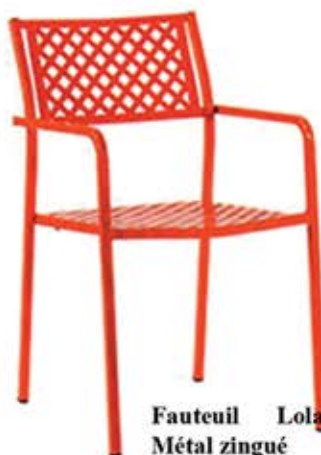
Fauteuil Lola Métal zingué recouvert de polyester 10 teintes à choix Dès Fr. 89.-