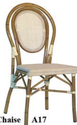
Chaise A17 Alu teinté rotin Toile en textylène Fr. 108.-