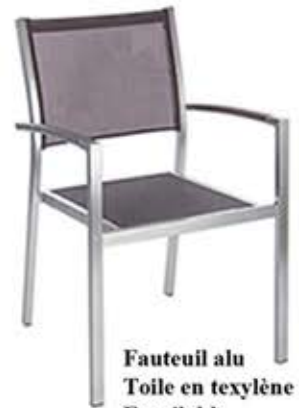
Fauteuil alu Toile en textylène Empilable Fr. 124.-