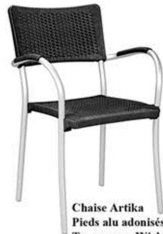
Chaise Artika Pieds alu adonisés Tressage en Wicker Fr. 98.-