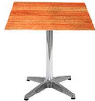
Table carrée de 70 x 70 cm Pied en aluminium fixe Plateau en werzalit Dès Fr. 245.-