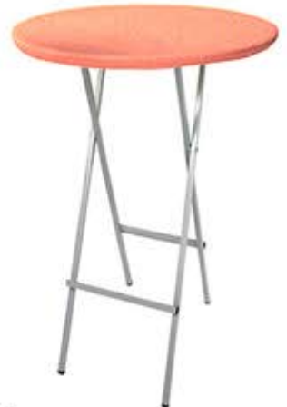
Tables hautes avec plateau rabattable Pied central en aluminium encastrable ou pied en métal zingué pliable Avec plateau compact Dès Fr. 285.- Avec plateau en werzalit Dès Fr. 250.-