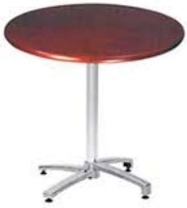
Table ronde de Ø 70 cm Avec plateau compact Dès Fr. 275.- Avec plateau werzalit Dès Fr. 255.-