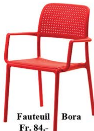
Fauteuil Bora Fr. 84.-